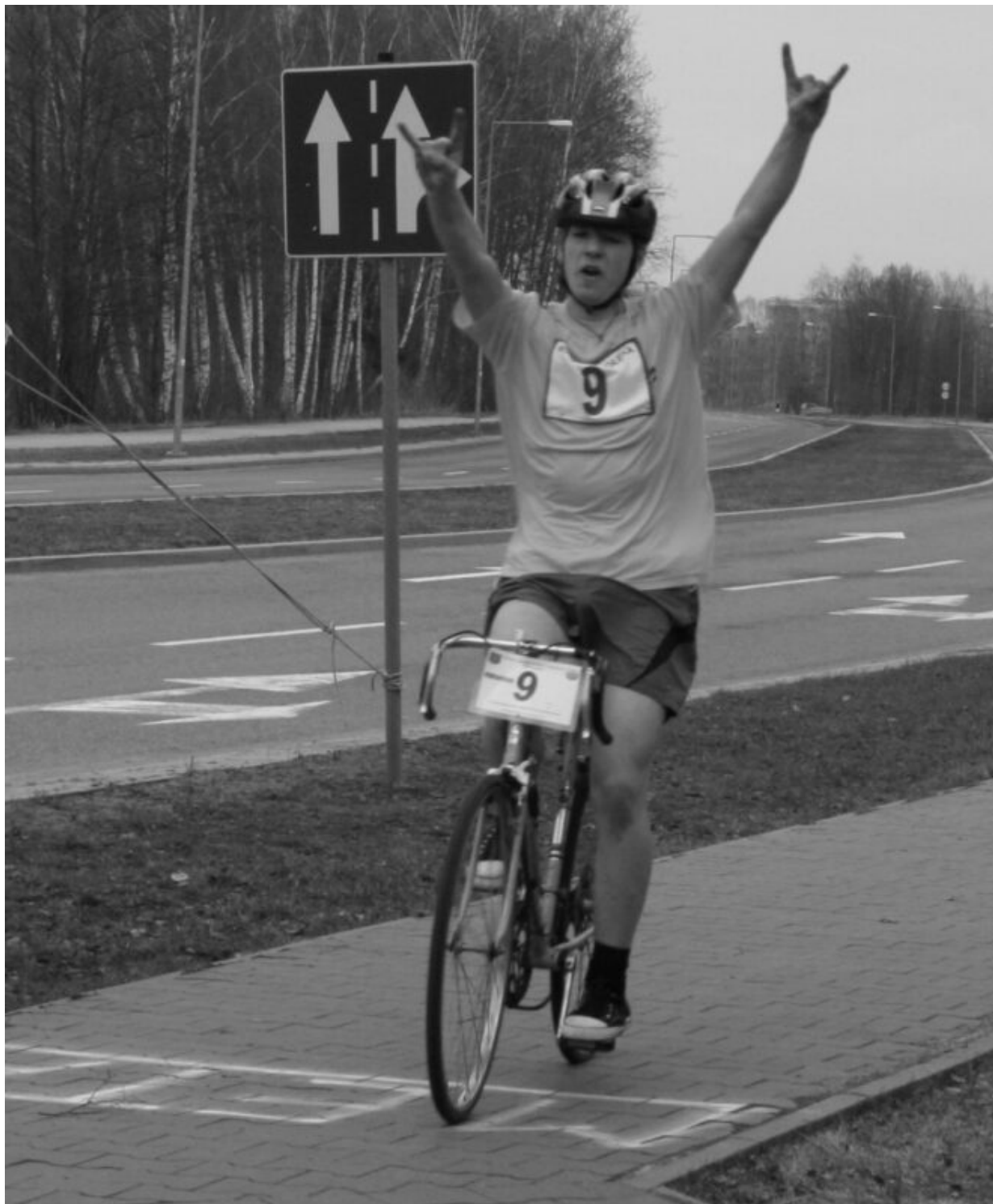
2011 Duathlon ostrołęcki