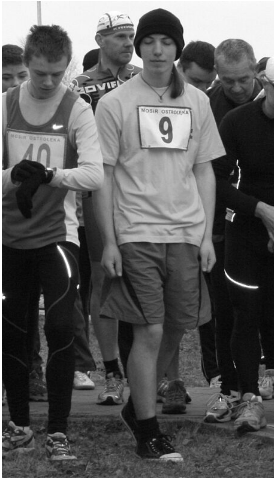
2011 Duathlon ostrołęcki