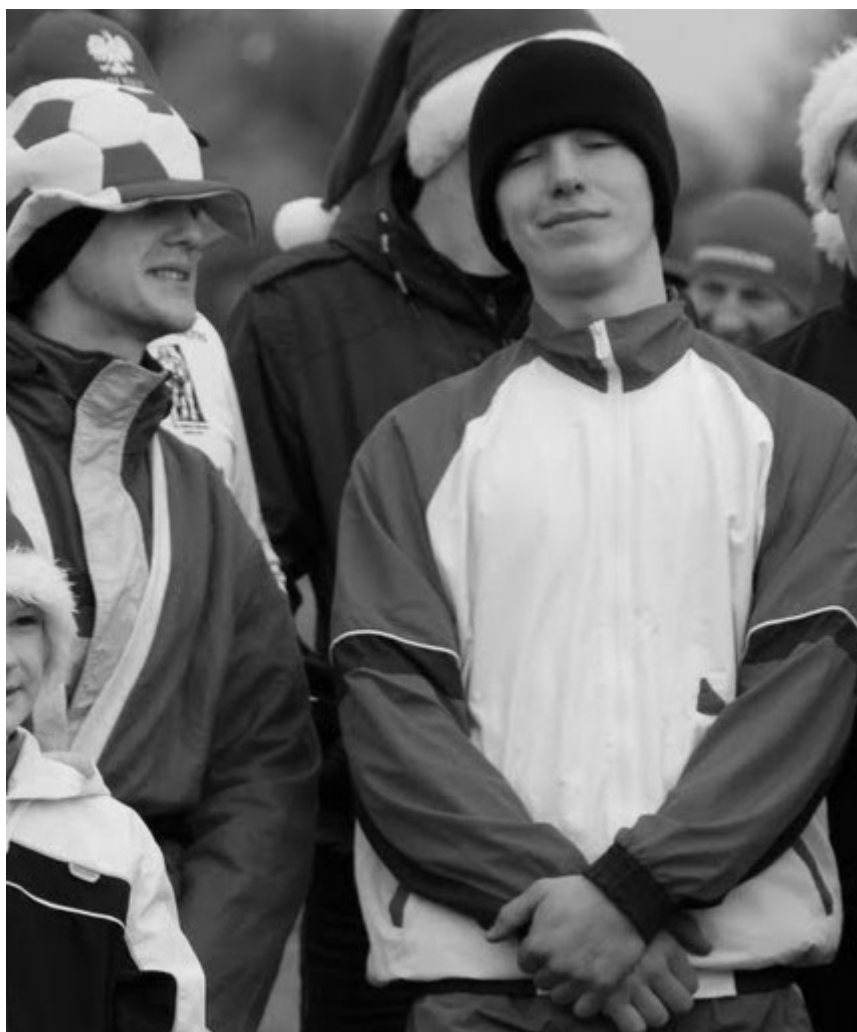
2011.12.04-Czarnowiec_Bieg Mikołajkowy