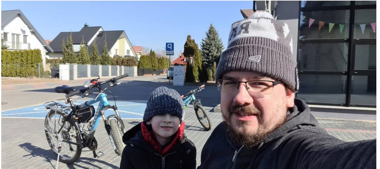
Rowerowanie po Czarnowcu i okolicy