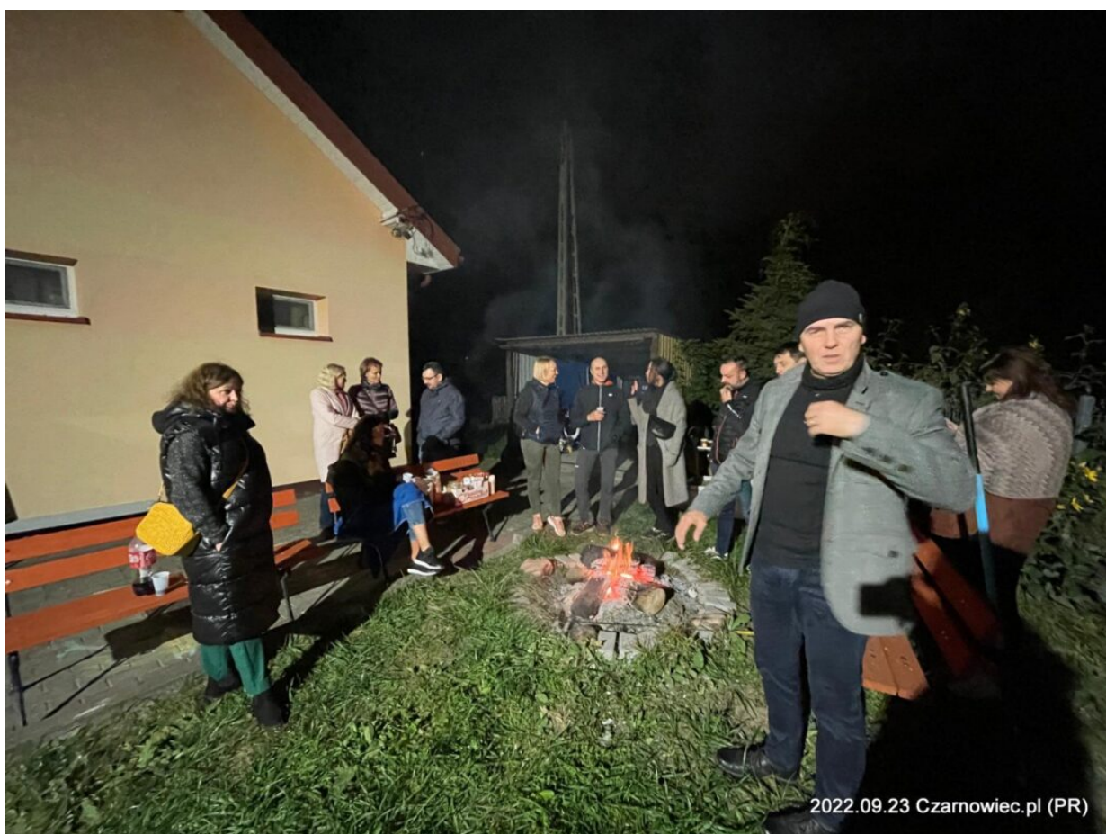
2022.09.23 Czarnowiec.pl (PR)