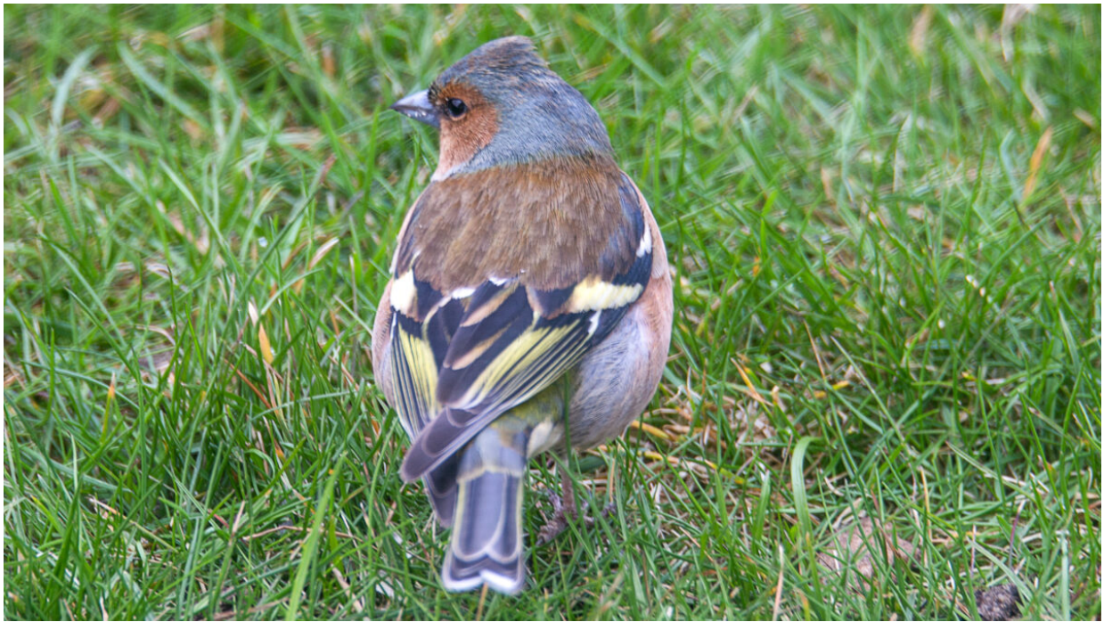
Ptaki Krzysztofa Chojnowskiego (w Czarnowcu)