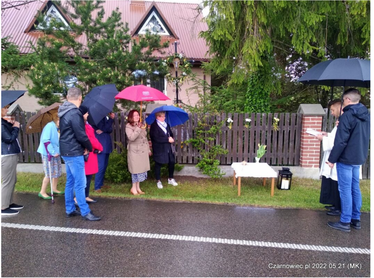
Czarnowiec.pl 2022.05.21 (MK)