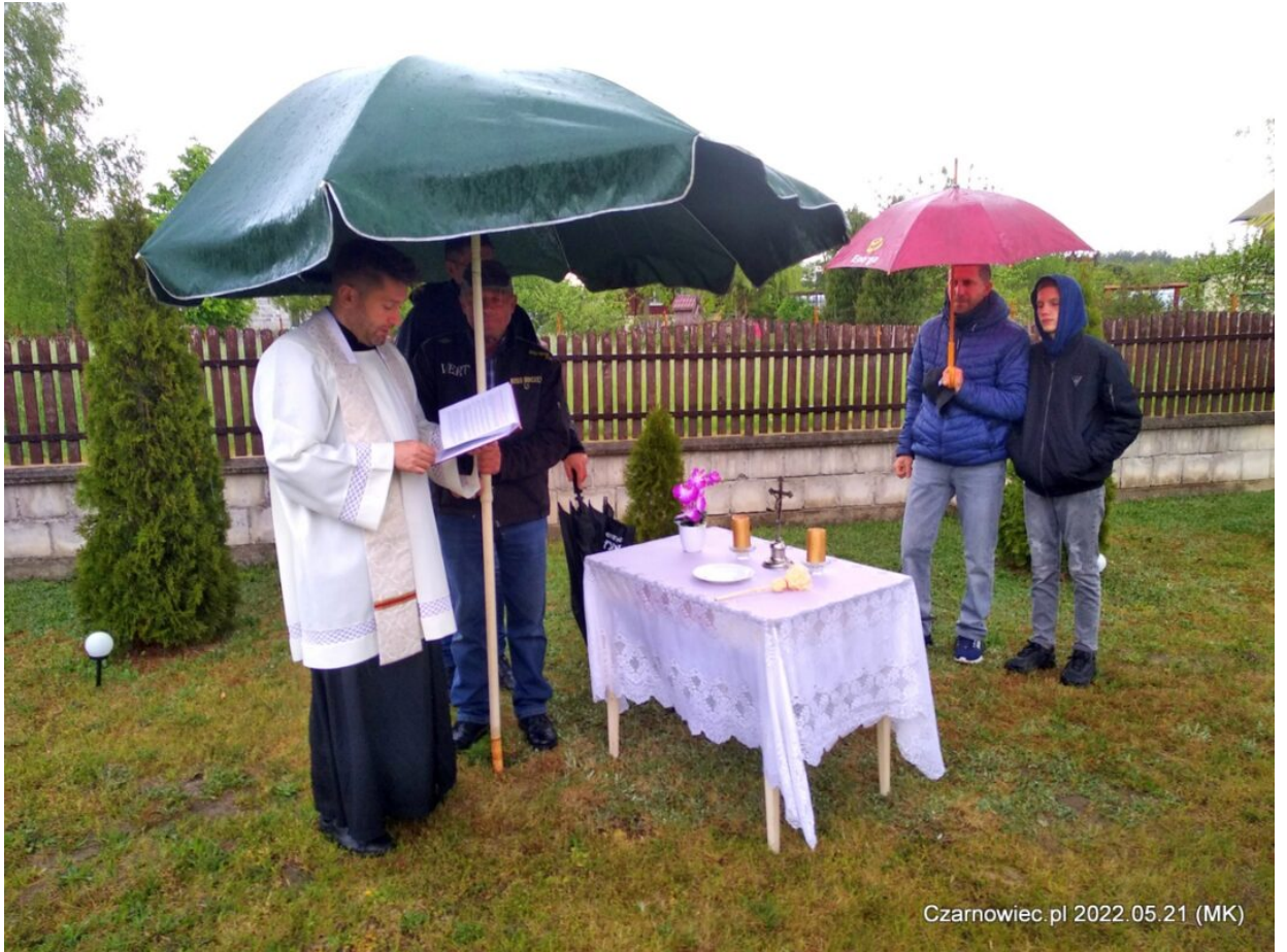
Czarnowiec.pl 2022.05.21