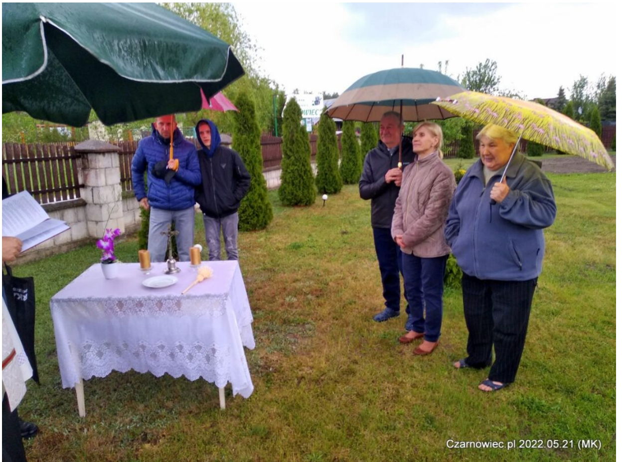
Czarnowiec.pl 2022.05.21