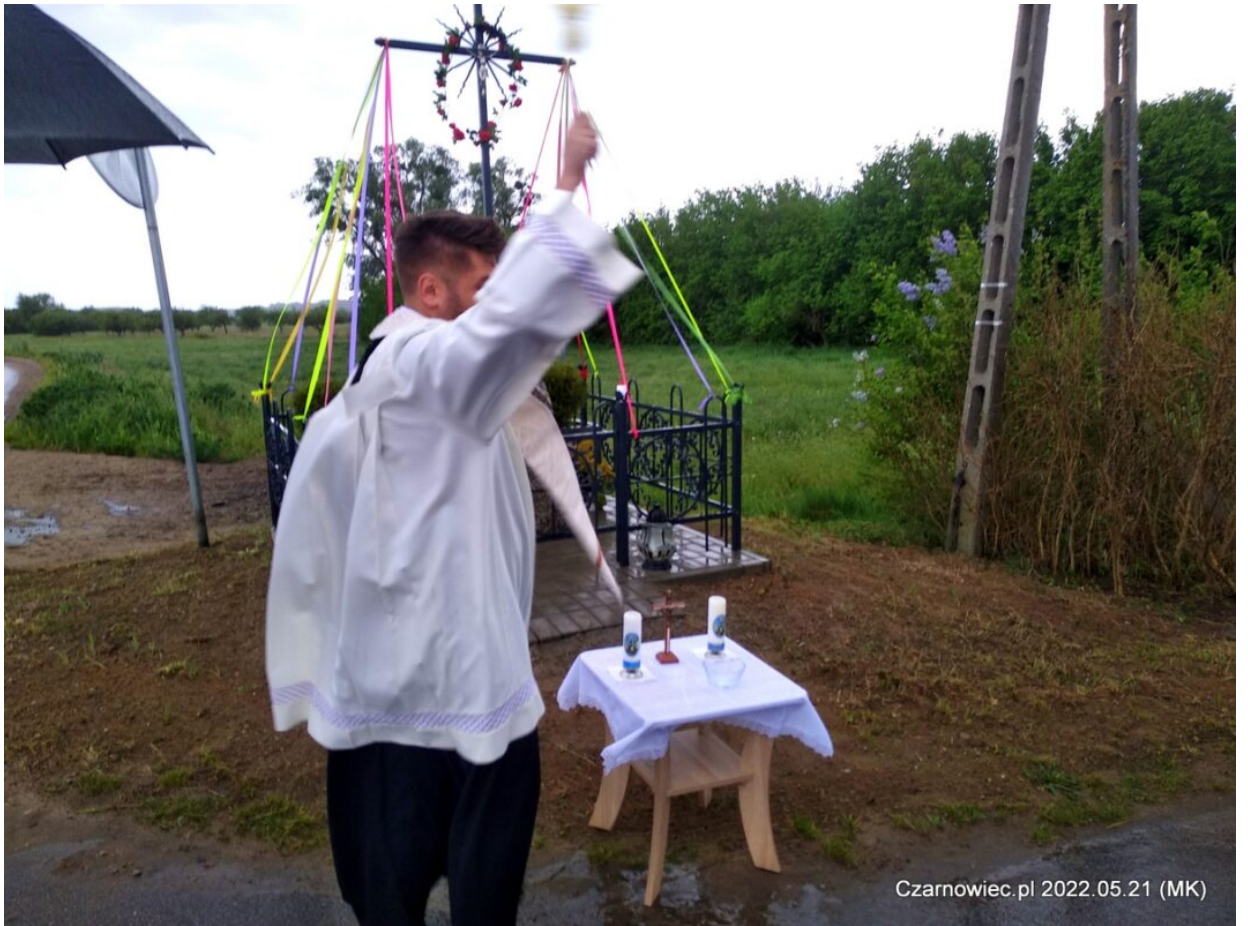
Czarnowiec.pl 2022.05.21