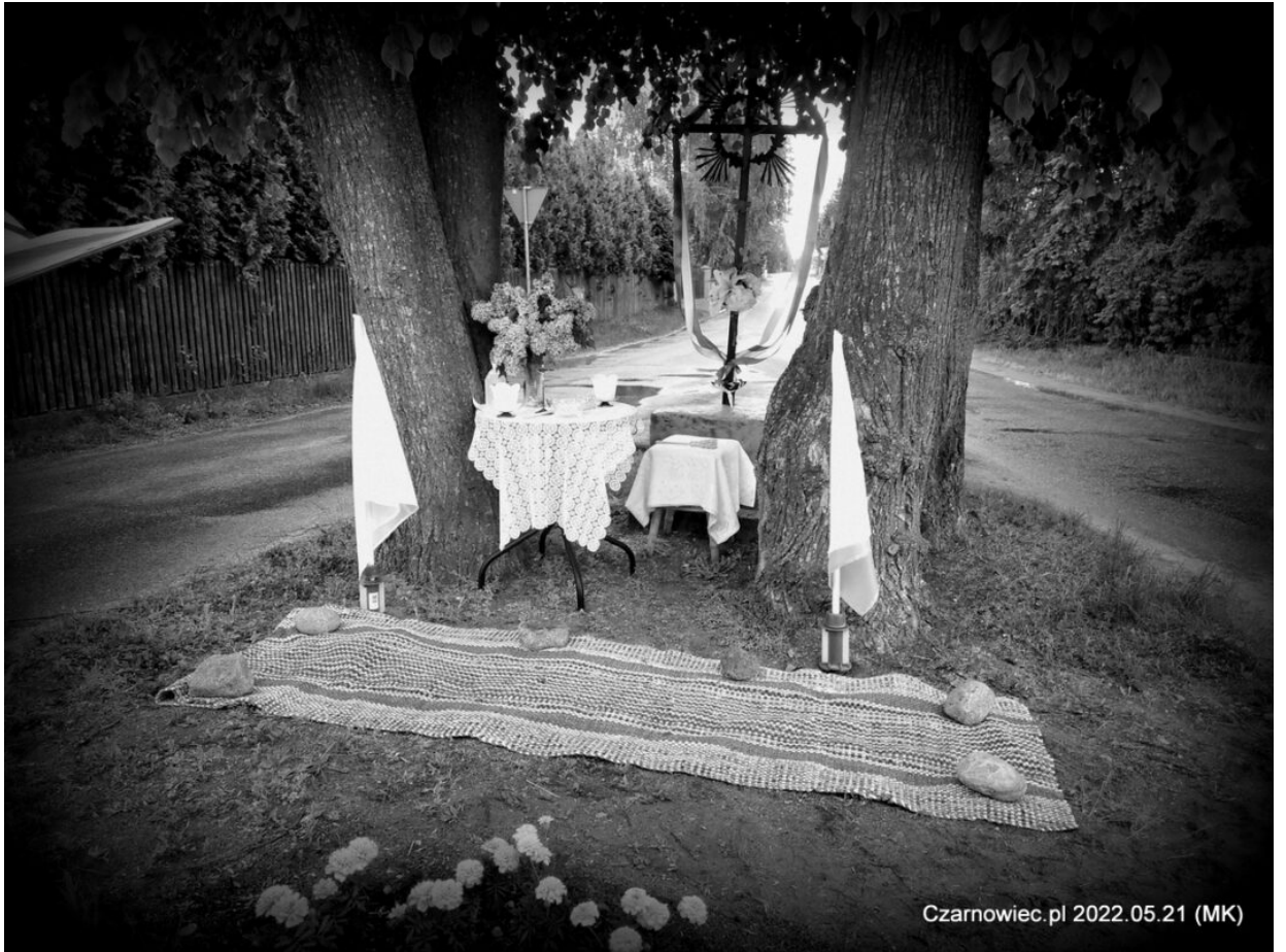
Czarnowiec.pl 2022.05.21