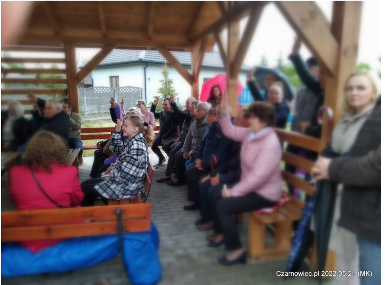
Czarnowiec.pl 2022.05.21