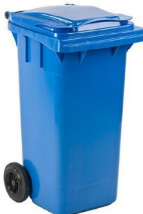
Opakowania z papieru i tektury