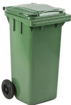
Opakowania szklane kolorowe i bezbarwne