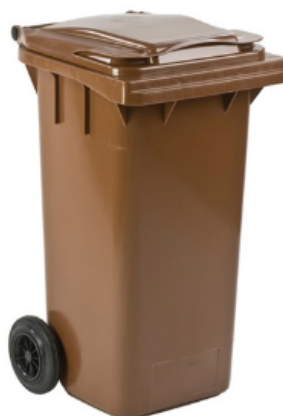
Odpady biodegradowalne zielone i kuchenne