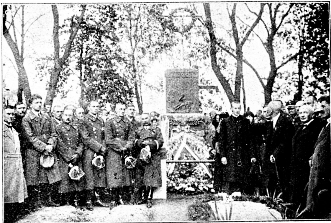
Poświęcenie pomnika na grobie poległych żołnierzy 2-go p. ułanów w Rzekuniu.