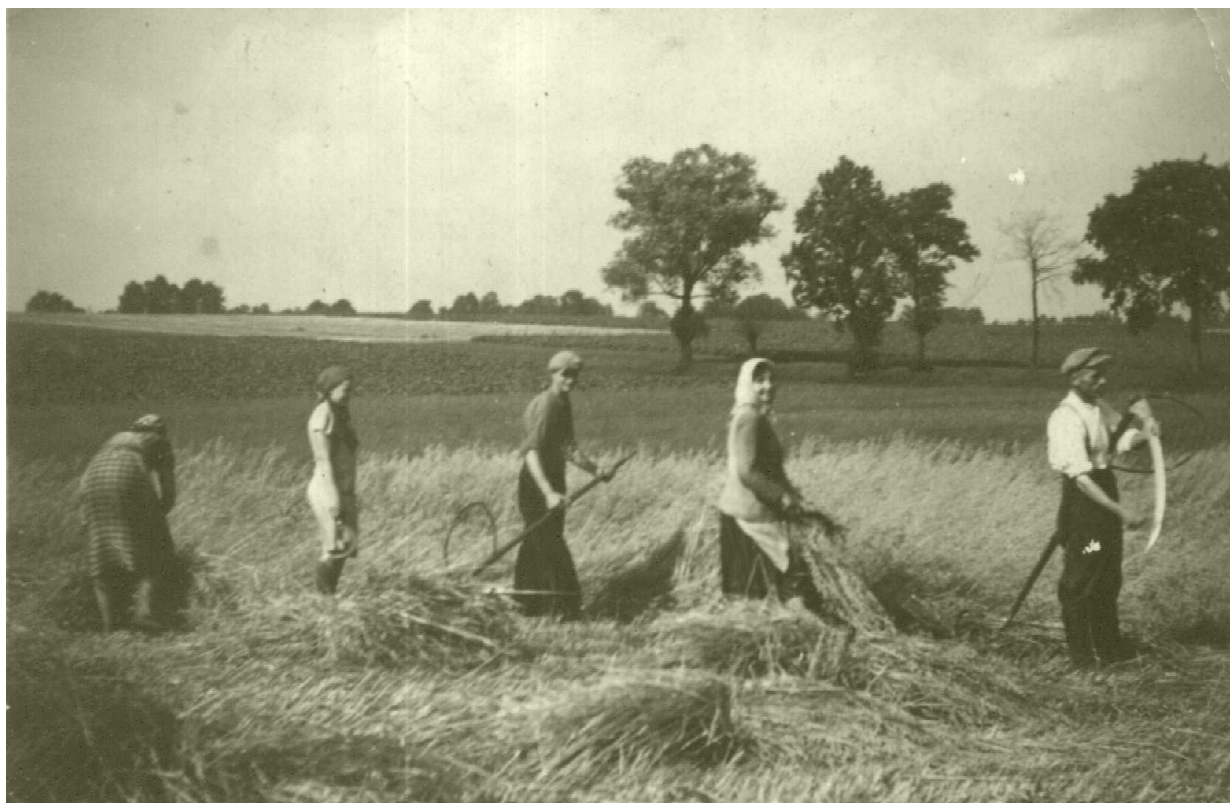
Praca w polu kosami.

Robotnicy folwarczni zamieszkali w przydzielonych przez gminę izbach (we dworze), a część ziemi z ponad 70-cio hektarowego gospodarstwa Wyszomirskich rozparcelowano wśród nich, w latach 70-tych XX wieku.