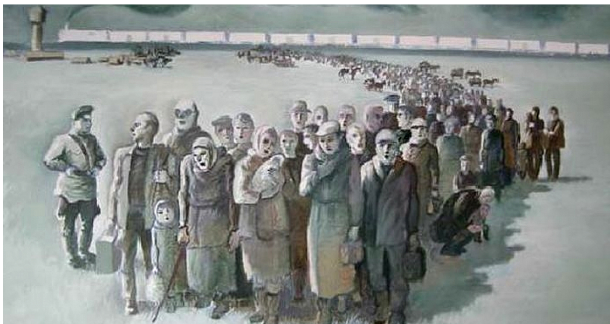
Wywózka na Sybir.

Układ geograficzny ronda, na skraju Ostrołęki choć już na terenie gminy Rzekuń - patrząc na wschód to doskonale upamiętnienie deportowanych mieszkańców gminy na Sybir.