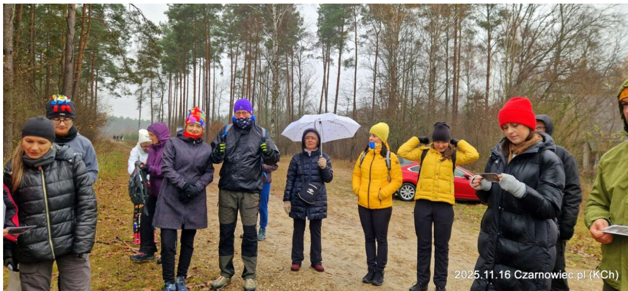
2025.11.16 Czarnowiec.pl