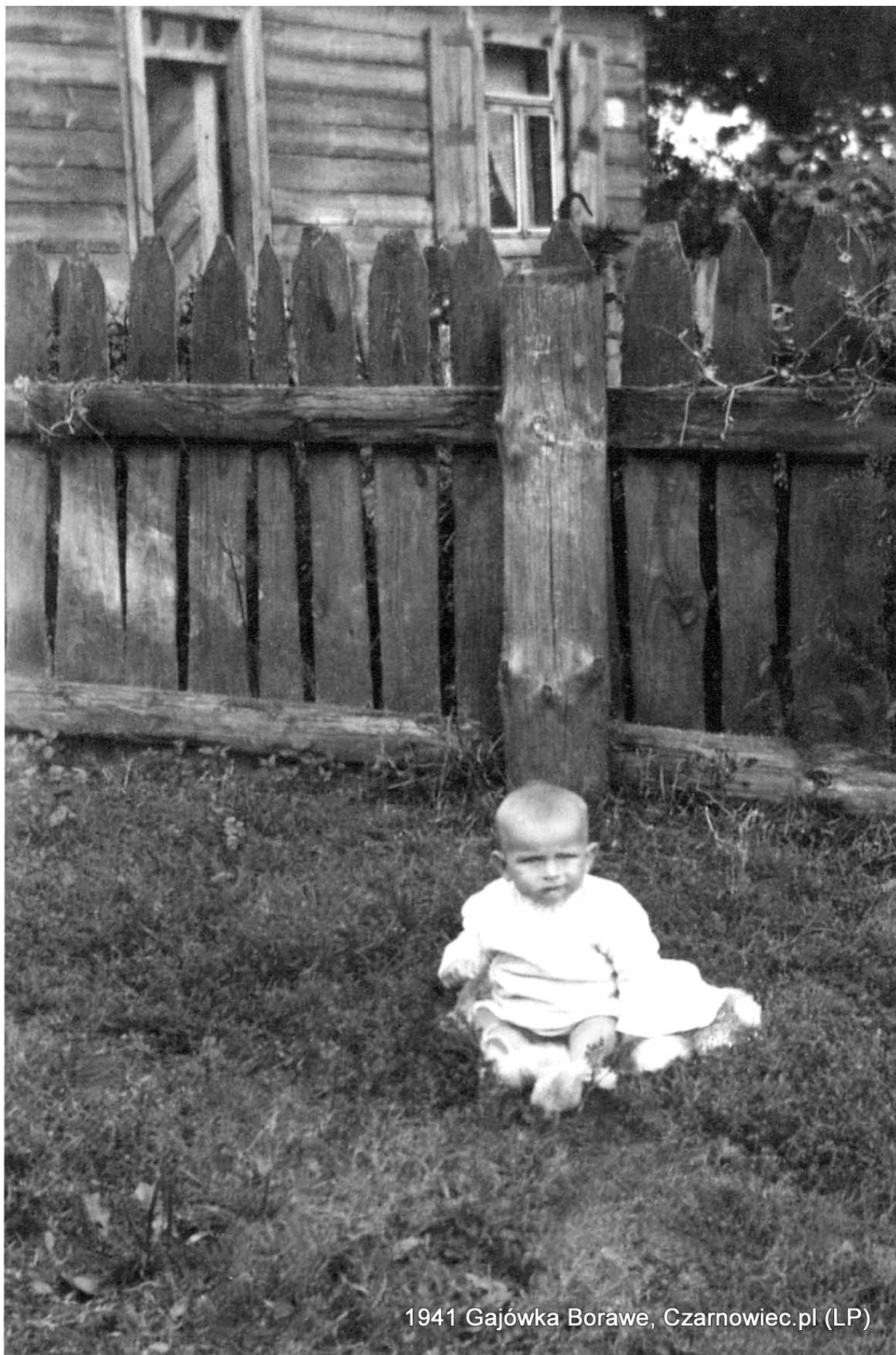
1941 Gajówka Borawe, Czarnowiec.pl (LP)