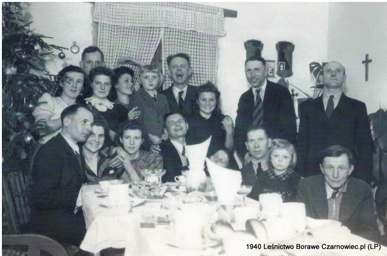
1940 Leśnictwo Borawe Czarnowiec.pl (LP)