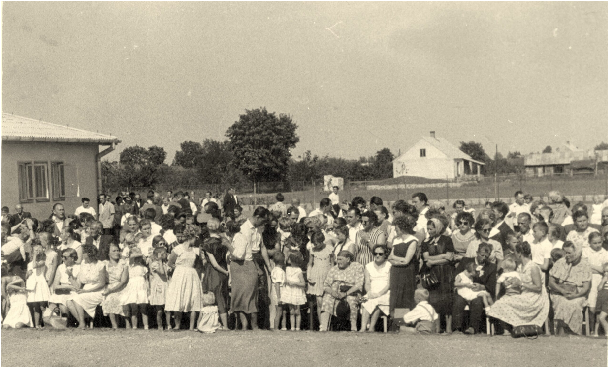
1960 r. Uroczystość otwarcia szkoły tysiąclatki.