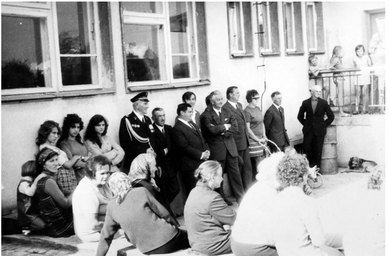
1975 r. - uroczystość przekazania Sztandaru.