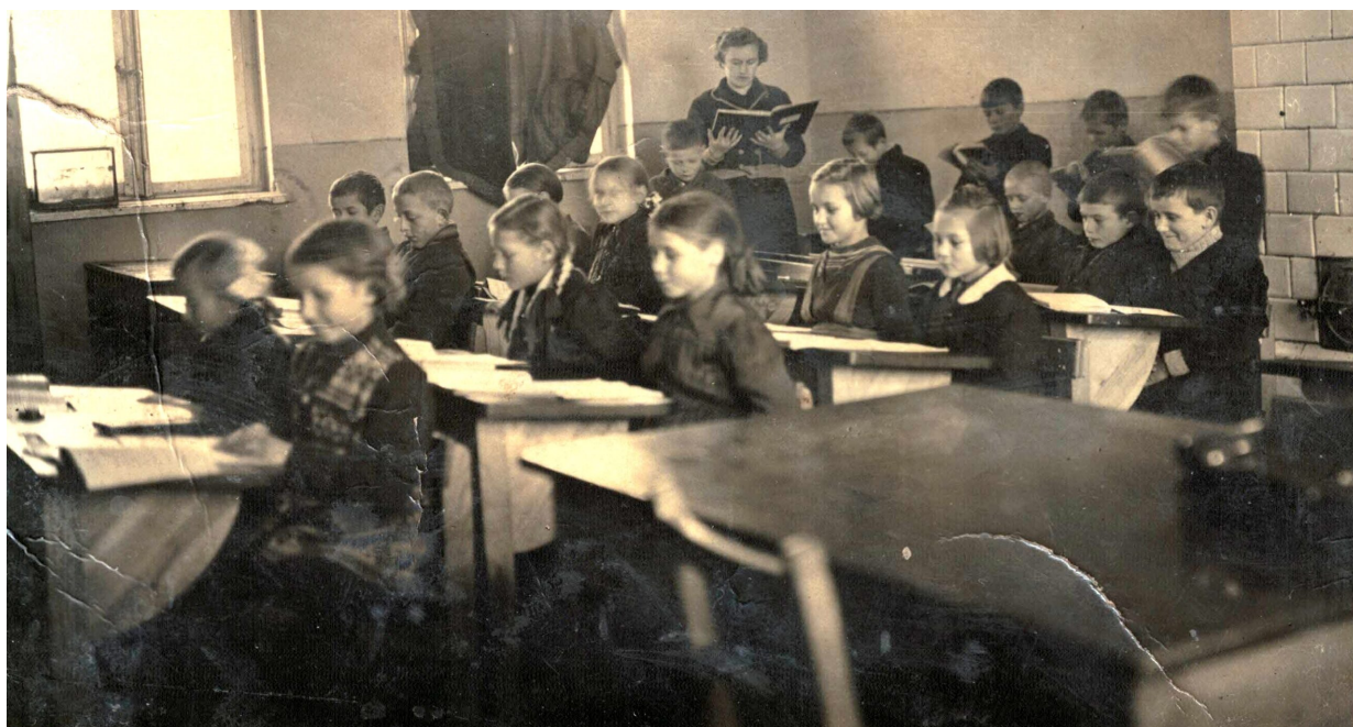
1957 r. - szkoła „u Jakackich” kl. V.

W tym roku szkolnym rodzice opodatkowali się po 50 zł na zakup kamienia pod budowę szkoły. W miesiącach: maj, czerwiec i lipiec zwieziono 48 m 3 kamienia.