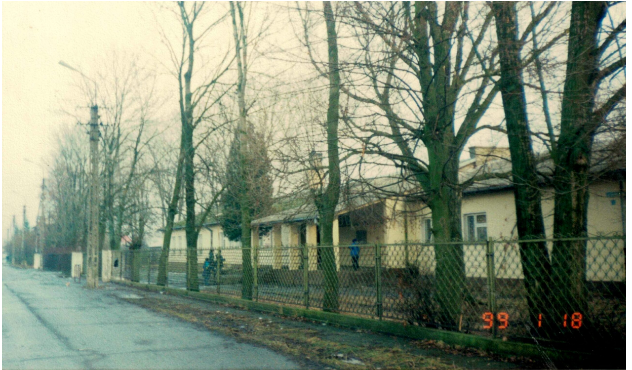
1999.01.18 - budynek szkoły, widok od ul. Szkolnej.

(indeks skopiowany ze szkolnej strony www)