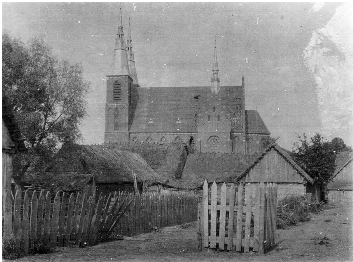
1915 r. zabudowania w Rzekuniu, foto z tablicy FB Remigiusza Makowieckiego

W sierpniu 1915 roku Rosjanie opuścili gminę Rzekuń i wycofali się na wschód. Na ich miejsce wkroczyło wojsko niemieckie. W początkowym okresie nowy okupant, tym razem niemiecki niezbyt chętnie szedł na ustępstwa w sprawach swobód narodowych Polaków. Z czasem jednak, gdy rosły jego trudności militarne, wówczas Niemcy mieli ważniejsze sprawy niż kwestia polskiego szkolnictwa. Poza tym chcieli jak najwięcej zaangażować Polaków do walki z Rosjanami. W takiej sytuacji musieli iść na ustępstwa w kwestii narodowej. Polacy więc zaczęli samodzielnie zakładać polskie szkoły i stawiać okupanta wobec faktów dokonanych. Wznowiła działalność Polska Macierz Szkolna, która główny wysiłek skupiła na przygotowaniu nauczycieli do polskiej szkoły. Duże ułatwienie w rozwoju polskiego szkolnictwa