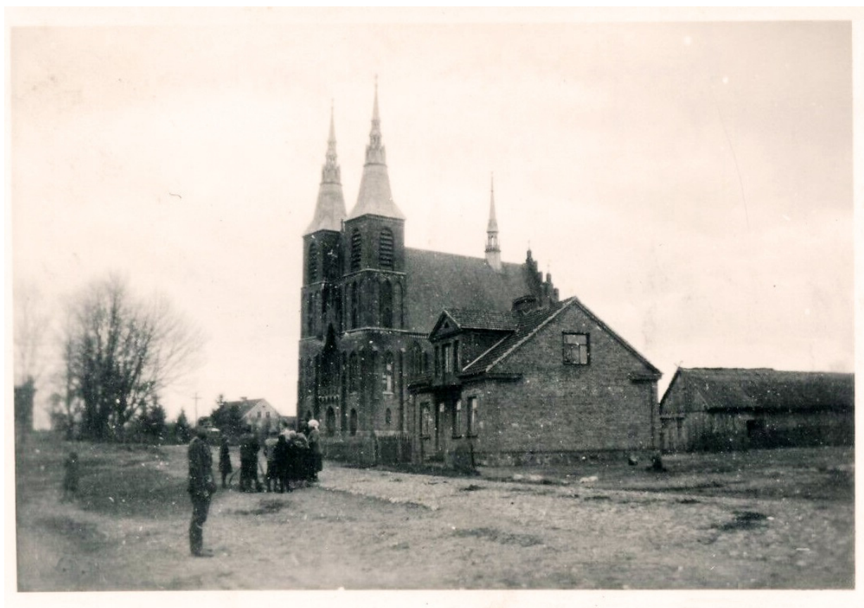
1941 r. Rzekuń.