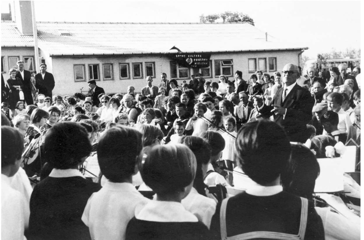
1975 r. - uroczystość przekazania Sztandaru.