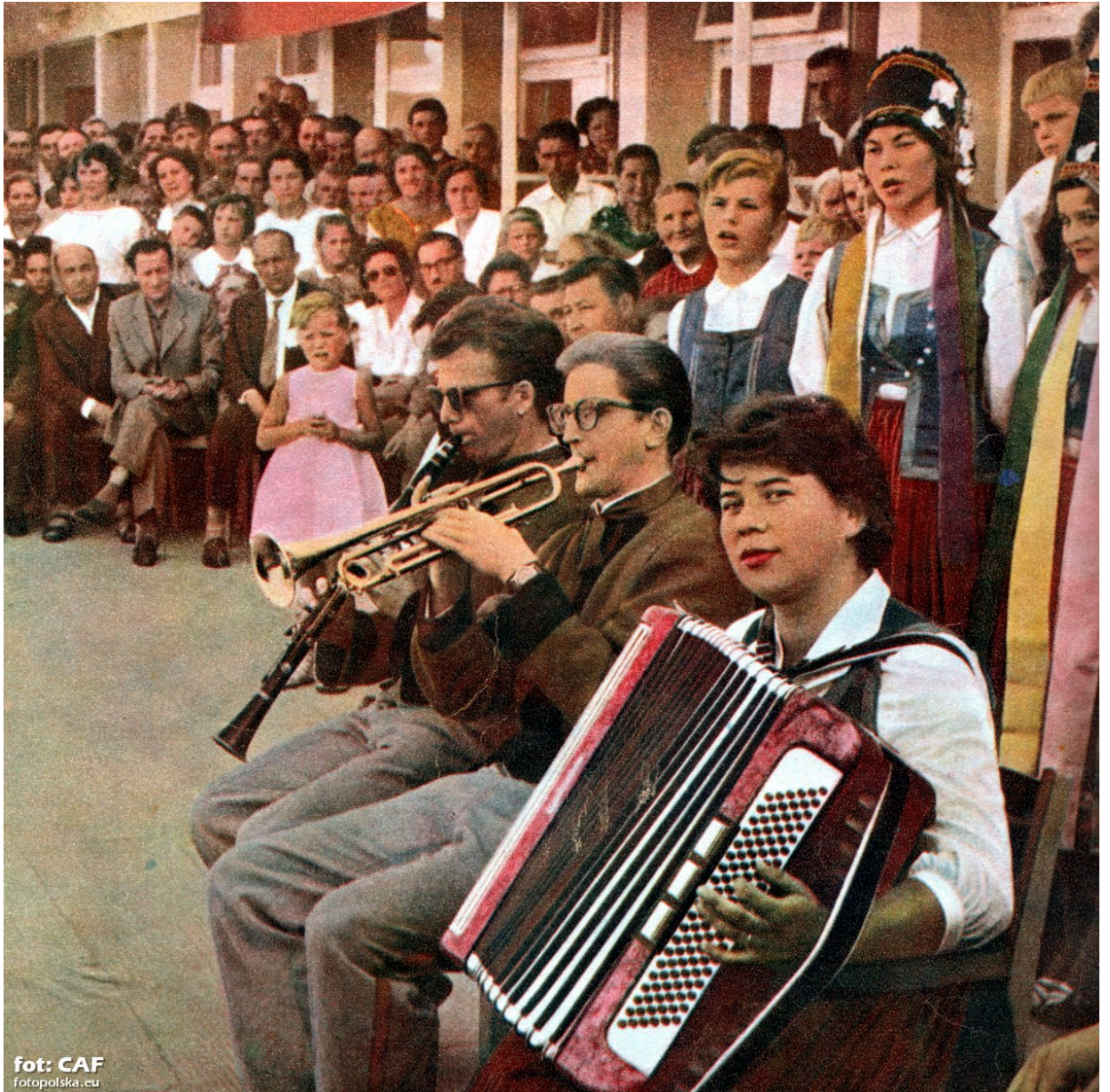
Otwarcie szkoły 1960 r.