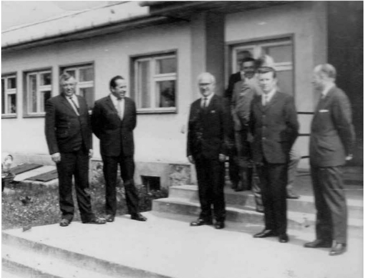
28.08.1960 r. Otwarcie szkoły i nadanie imienia.

W części oficjalnej odbyły się przemówienia oraz odczytanie Aktu Przekazania Szkoły Pomnika 1000-lecia im. gen. Józefa Bema w Rzekuniu.