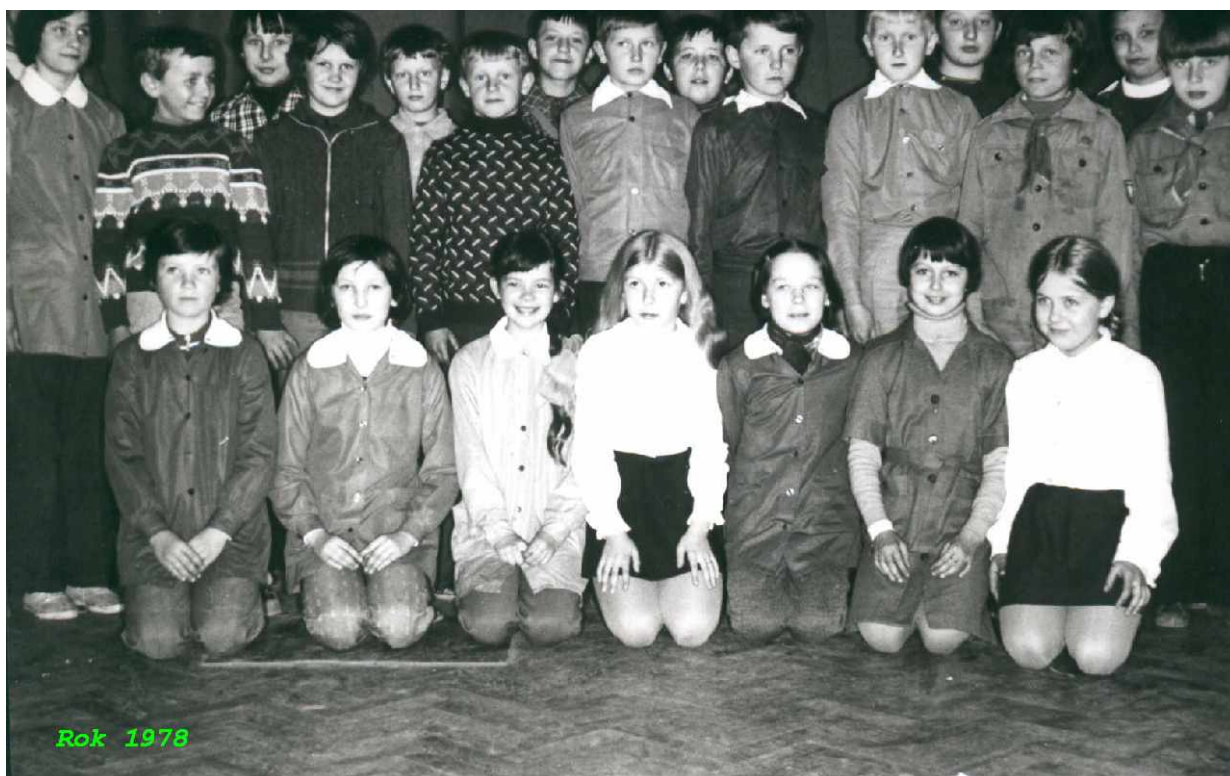
Klasa VII a

Z serca gratuluję i życzę kolejnych pięknych rocznic!”