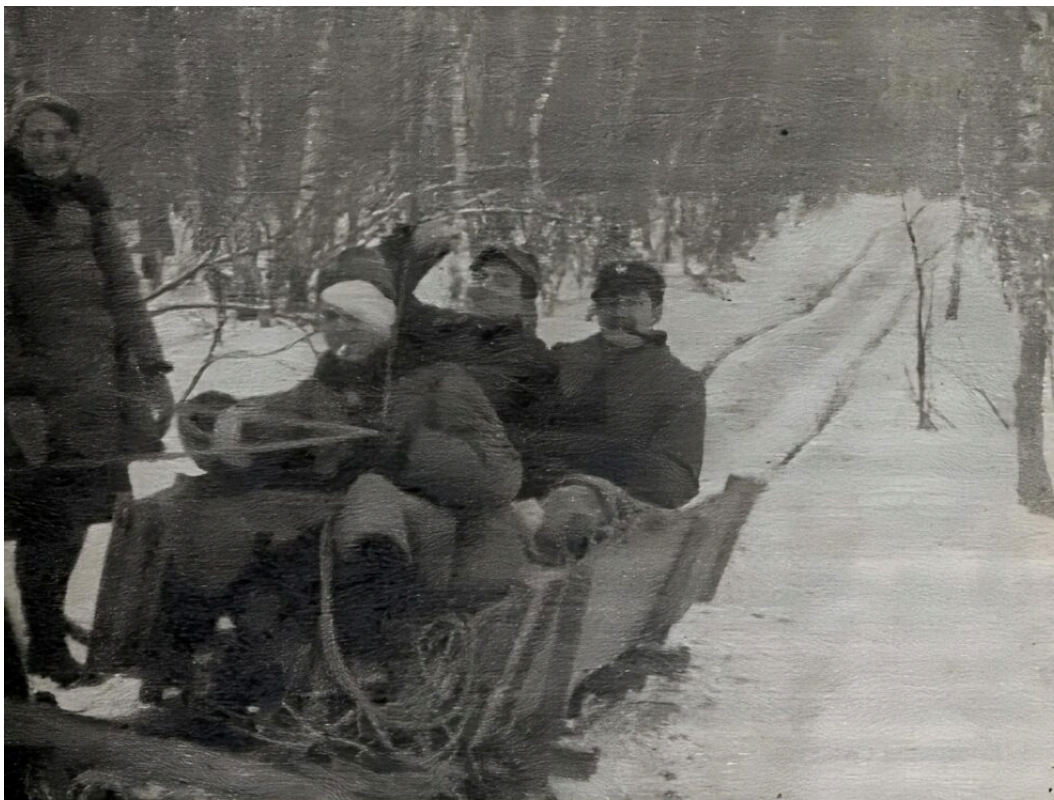
W drodze do Niecieczy — „Janka”, „Połaniecki”, „Wroński”, „Sambor”