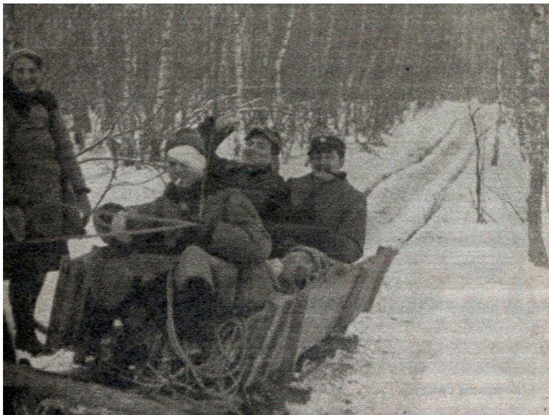
W drodze do Niecieczy — „Janka”, „Połaniecki”, „Wroński”, „Sambor”

Category: Historia, historyczne written by Jacek | 2 lipca 2022